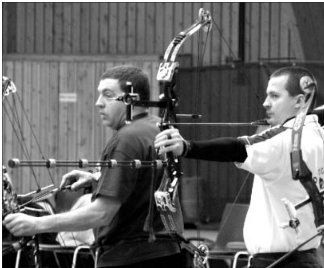
Les meilleurs archers de Belgique s'étaient donné rendez-vous à Bertrantsart pour une compétition qui a enregistré un record francophone et un autre national.

Le club organise, à l'instar de beaucoup d'autres cercles, une compétition annuelle. Elle a eu lieu tout ce week-end. Il s'agissait en fait d'une des manches de la « Belgian Archery Cup Indoor », une sorte de coupe de Belgique qui en comporte quatre (les trois autres ont lieu à Mol, Ottignies et Rumst). Soixante archers ont participé à la compétition à 18 m pour arcs « compound » (à poulies) le samedi, et quatre-vingts autres le dimanche pour la compétition pour arcs « recurve » (arcs plus classiques et repris dans le programme des Jeux Olympiques). « L'importance de cette compétition est grande vu qu'elle constitue un passe-droit pour une éventuelle participation à des championnats d'Europe et du